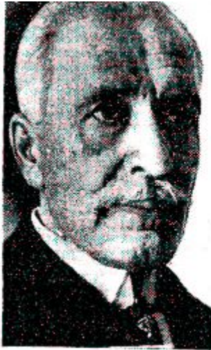
Ignace Moscicki, who resigned in Rumania, where he was interned.